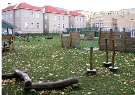
vnitřní areál školy – dětská zahrada, parkoviště, vstup do školičky